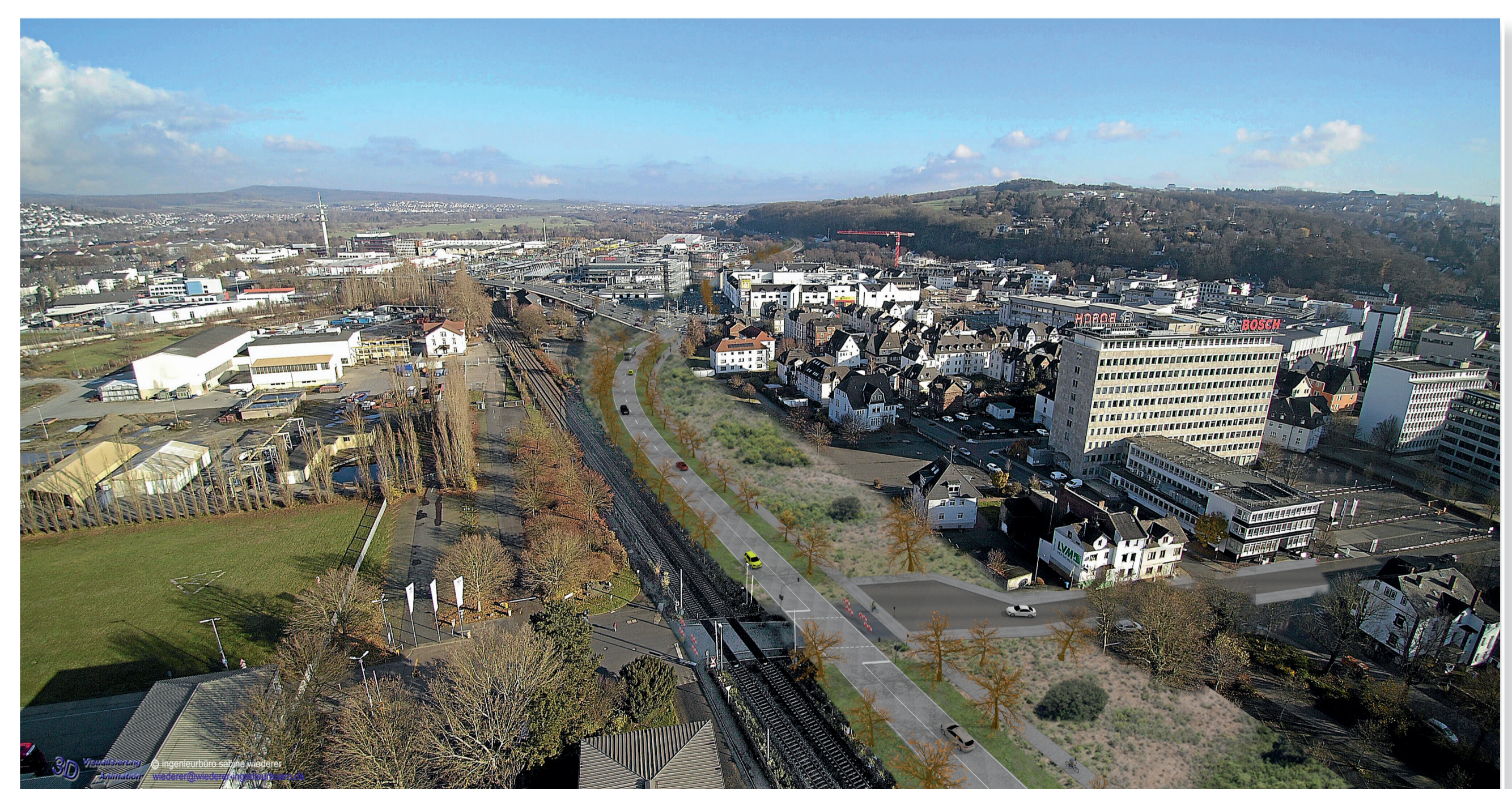
... und in Zukunft