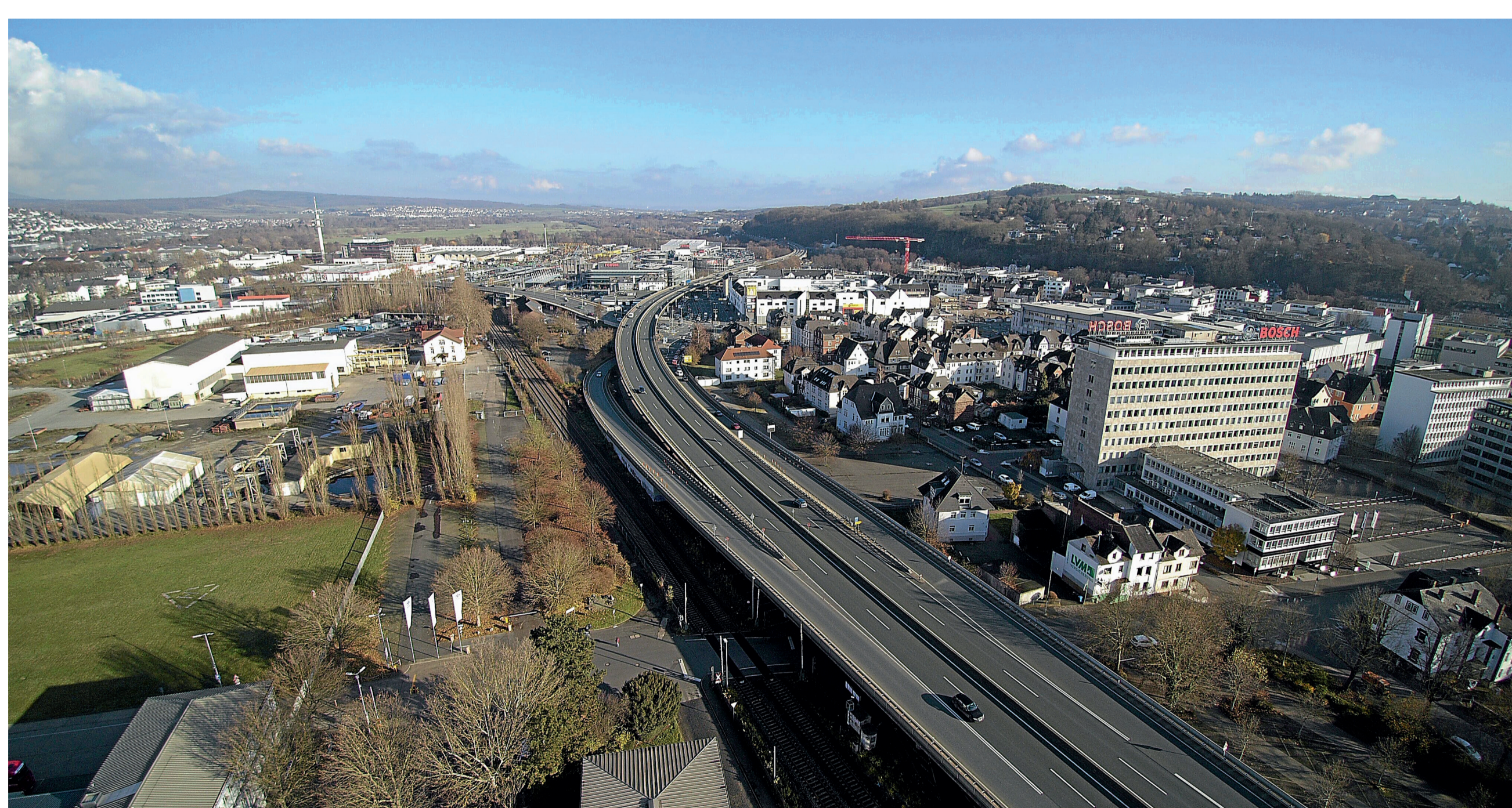
Die Hochstraße aktuell ...