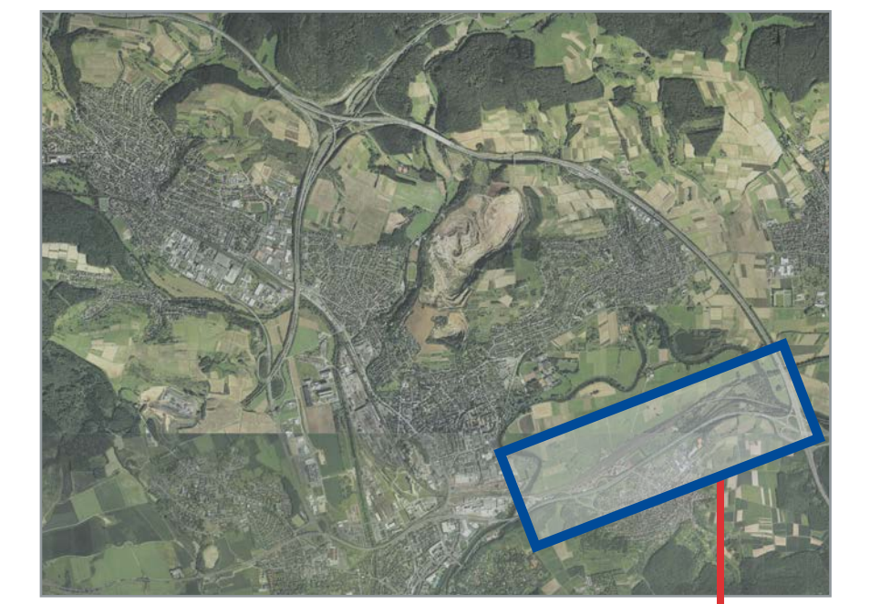
Wir befinden uns hier

Im östlichen Abschnitt der B49 werden mehrere Bauwerke instandgesetzt. Die Bauwerksinstandsetzungen der Vorabmaßnahmen Ost sind die Voraussetzungen für eine Weiternutzung der B49 zwischen der Taubensteinbrücke und der Anschlussstelle A45/B49